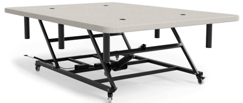
980 Largo: 190cm y 200cm. Ancho: 135cm y 150cm.