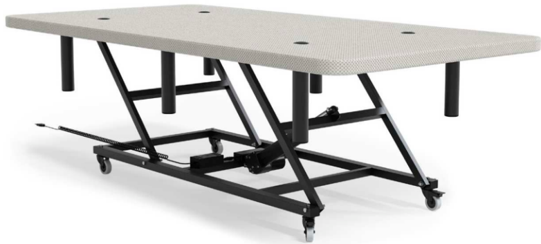
610 Largo: 190cm y 200cm. Anchos: 90cm 100cm y 105cm.